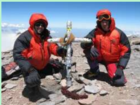
Le sommet de l'Aconcagua

L'aspect socio-économique, qui est un des piliers du développement durable, se retrouve en effet dans les Principes Fondamentaux de la Charte Olympique, où le devoir de l'Olympisme est décrit comme étant de « placer le sport en tout lieu au service du développement de l'homme, avec l'objectif d'encourager l'établissement d'une société de paix concernée par le respect de la dignité humaine».