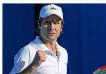
Fabrice SANTORO – Tennisman