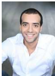
Tarek BOUDALI – Humoriste