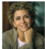
Corinne TOUZET – Comedienne