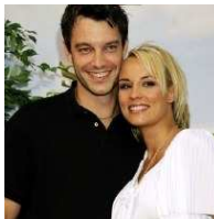
Elodie GOSSUIN - LACHERIE – Miss France & Europe Bertrand LACHERIE Top Model