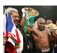
Jean-Marc MORMECK – Boxe