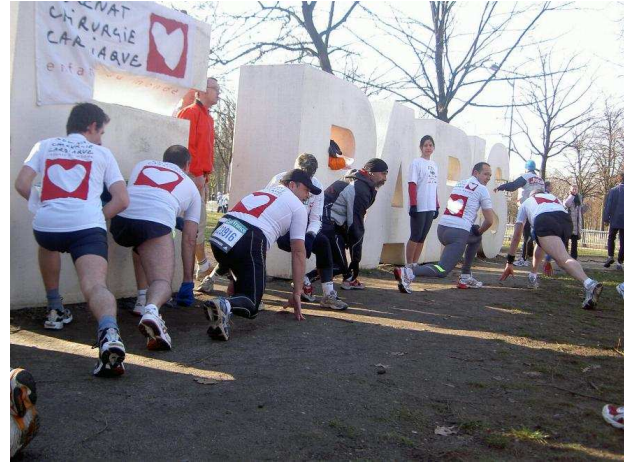
Les coureurs du cœur à l'échauffement

Vous trouverez plus de photos sur le site Internet : http://www.coureursducoeur.com/